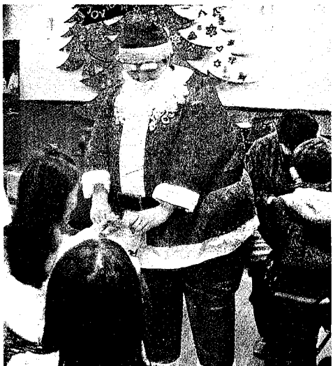
教会には信者以外の人も訪れる(聖パウロ礼拝堂) 写真上。白いひげと赤い服装のサンタクロースは今やすっかりおなじみだ 写真下

教会では厳かにクリスマス礼拝が行われている。サンタがそこに登場することはない。喧嘩けんそうの街を逃れ、本来のクリスマスの雰囲気味わってみるのもいい。