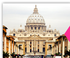
ローマ・カトリック教会 (ヴァチカン)