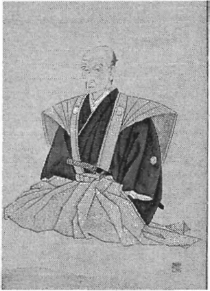
30 山田方谷 手県、下風 呂(青森県) に寄港し た。箱館紀 行」③はこ の時の日記 である。