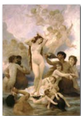
ウィリアム・ブーグロー 『ヴィーナスの誕生』(1879年) オルセー美術館