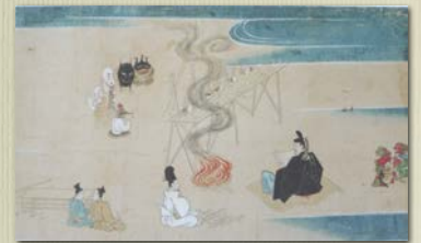
疫病神退治をする安倍晴明（泣不動縁起より）