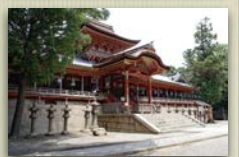
石清水八幡宮 本殿