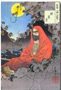
月岡芳年画『達磨図』 (木版画 1887年)