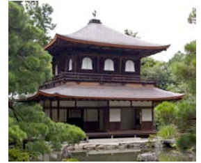
The Silver Pavilion