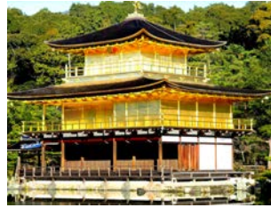
The Golden Pavilion