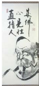
白隠慧鶴 (1685-1768) 筆 『達磨図』