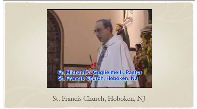
St. Francis Church, Hoboken, NJ