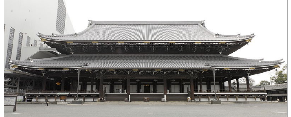
ごえいどう 御影堂

創建：1175年 開基：法然（1133-1212） 宗派：浄土宗 専修念仏（南無阿弥陀仏）