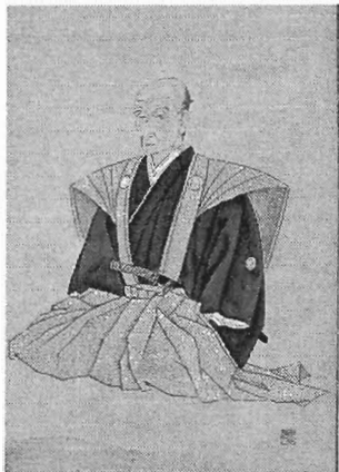
30 山田方谷 行」③はこ の時の日記 である。