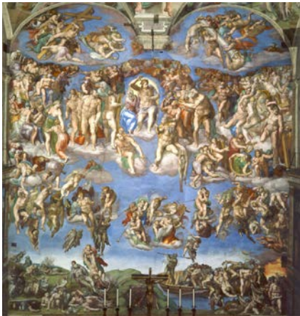
ミケランジェロ「最後の審判」（システリーナ礼拝堂）