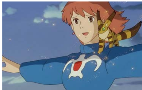
オームの群れの上を歩くナウシカとテト