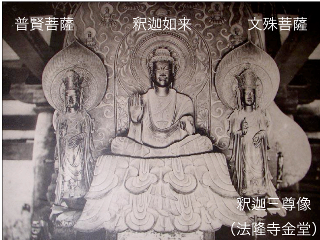
釈迦三尊像 (法隆寺金堂)